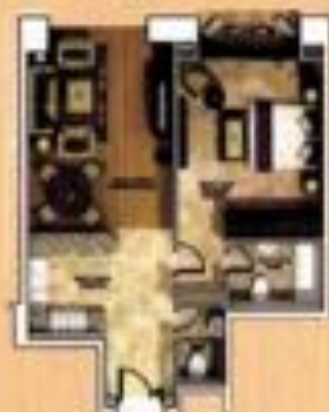
جناح ابو ظبي