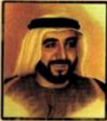
مدير العمليات مخيمت دبي للسياحة والفنادق مخيمت دبي للسياحة والفنادق