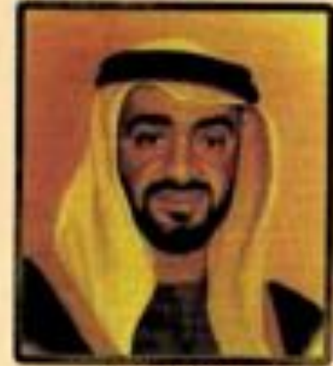
مدير العمليات مخيمت دبي للسياحة والفنادق مخيمت دبي للسياحة والفنادق