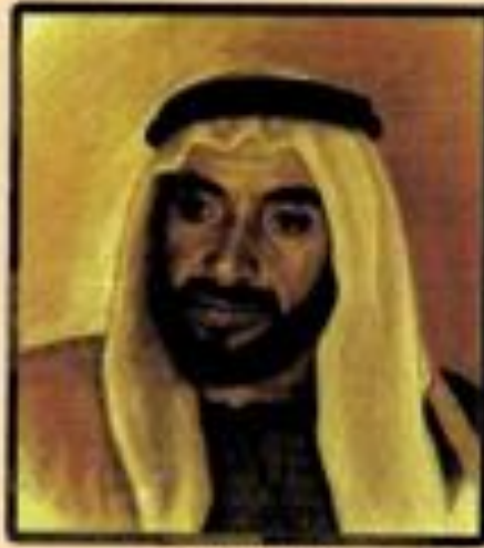
مدير العمليات مخيمت دبي للسياحة والفنادق مخيمت دبي للسياحة والفنادق