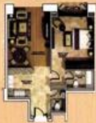
جناح ابو ظهري